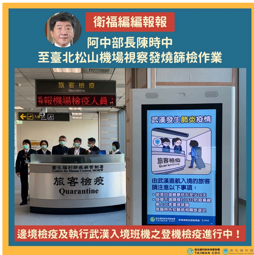
図終-1 2020年1月2日、台北松山空港の検疫所を視察する陳時中衛生福利相