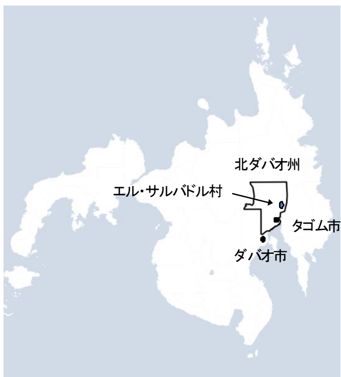
図1 フィリピン、ミンダナオ島エル・サルバドル村の位置

調査地である北ダバオ州ニュー・コレリア町バランガイ・エル・サルバドル（以下、エル・サルバドル村）は、商業伐採跡地に土地を求めて移住してきた人々によって形成された集落がバランガイとなったところである。通直な大径木であるフタバガキ科樹種の天然林に恵まれたミンダナオ島の国有林地は、戦後の早い時期に商業伐採対象として企業に長期伐採権(25年間)が与えられた。林道の敷設、大径木の伐採、企業のゆるい林地管理は、土地を求める人々にとっては移住を促進させる要因であった。商業伐採跡地がバランガイとなった山村はフィリピンの国有林地各地にみられ、エル・サルバドル村はその典型例である。平坦地に広がる低地農村地帯のバランガイは、家屋が道路に沿って列状に存在する路村形状が多い。隣接するバランガイとの区切りは、標識がなければ認識困難である。一方で、山地のバランガイは家屋が塊状に存在する集落が複数分布する形状が多い。集落は互いに離れて立地していることが多い。