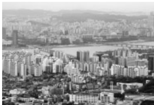
ソウル・漢江沿いの高層マンション群