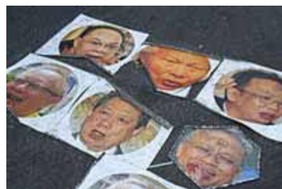
UDD集会場の路上に貼られた顔写真。中央上がブレイム枢密院議長。

一方、赤シャツ集団の主張は、「議会解散せよ」（選挙をしる）の一点であり、PADの「良き人による政治」と対照をなす。誰がこの国を治めるべきかは、国民に決めさせるべきであり、その方法は選挙でしかありえない。UDDは「解散せよ」と言う代わりに、「権力を民衆に返せ」とも主張している。