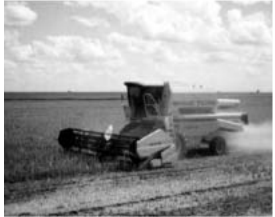
機械化された大規模農業

その後、次男と三男が共同経営する I 家の農業は規模を拡大していき、1980年代初めには総農地面積が400ヘクタール、94年には700ヘクタール、2005年には1000ヘクタールにまで拡大した。この1000ヘクタールという耕地面積は、現在のドウラードスの農業生産者のなかでも大規模なグループに入る(表2)。現在、I 家の実質的な農業経営は、次男と三男に加え、次男の息子によって行われている。近年の I 家の主な栽培作物は大豆とトウモロコシであり、その他にインゲン豆と小麦も栽培している。また、5人の農業労働者を常時雇用しており、農繁期には臨時でさらに数人雇用することがある。この農業労働者には法定最低賃金の2倍(一般的な相場は1.5~2倍)を給与として支払うとともに、収益が増加した場合には特別に手当てを支給している。また、彼らとの雇用関係は正規のものであるため、時間外労働手当、法律で1カ月分の給与額と定められた年末ボーナス、有給休暇などを支給している。