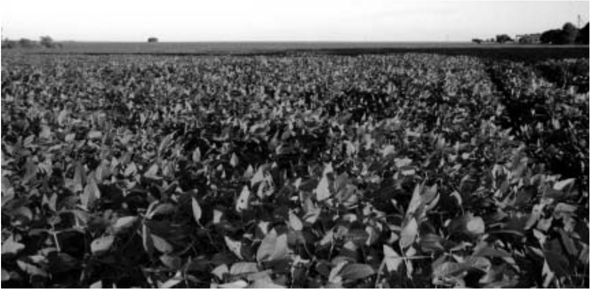
地平線まで続く大豆畑

このような広大な南マ州にあるドウラードスは (1) 、サンパウロ市からは約1006キロメートル、パラグアイの国境の町まで120キロメートルのところに位置する。ドウラードスは1935年にムニシピオ(日本の行政単位の「市」に相当)として創設され、当初の面積は2万1250平方キロメートルであったが、現在に至るまでに行政区域の改変等により、現在の面積は4096.9平方キロメートルとなっている。人口は同州では2番目に多いムニシピオ