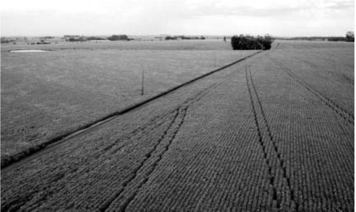
合計で1000ヘクタールにまで至るI家の農地

20世紀半ば頃までのドウラードス地方は、大企業による大規模な土地占有や大河に交通路を阻まれた陸の孤島といった地理的条件により、そのほとんどが未開拓の地であった (4) 。しかし、I家が入植した頃から、主に政府主導の農業開拓計画により大々的な開発が進められるようになっていた。これらの計画のなかに、1943年に立法化され56年から実施された連邦政府の「国営ドウラードス農業団地計画」(Colônia Agrícola Nacional de Dourados)がある。同計画は26万7000ヘクタールもの土地を30ヘクタール前後で区画分割し、初期は無償で、後に有償で1家族に1区画を提供するというものであった。また、州政府も同様の計画を実施し、5万ヘクタールの土地を最高50ヘクタールで区画分割し、新規の農業開拓者に無償で提供した。これら政府による計画の他に、民間主導の農業開拓計