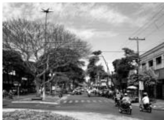
ドウラードスの中心街

ドウラードスのある南マット・グロッソ州(以下、南マ州)は、1977年にマット・グロッソ州から分離して新設された州であるが、面積は35万8159平方キロメートルで日本の国土37万7835平方キロメートルにほぼ匹敵する広さを有する。一方で、日本の人口密度が約336人/km 2 (2002年)であるのに対し、同州は約5.8人/km 2 (2000年)であり、ブラジル全体の約21人/km 2 (2002年)よりも少ない。同州の名称にある“Mato Grosso”とは、日本語に直訳すると“鬱蒼とした原始林”という意味である。以前はその大地が深い原始林に覆われていたのが、現在は一面広大な畑や牧場が広がる、ブラジルでも有数の農業生産地となっている(表1)。