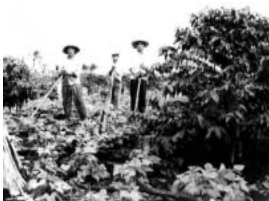
開拓時代のI家のコーヒー畑

1956年にパラナ州北部を經由してドウラードスに移り住んできたI家は、同年に農業を営むためブラジルに移民してきた外国移民の家族である 3) 。移民当時のI家の家族構成は、現在の世帯主の両親、その長男とその妻、長女、次男(現在の世帯主)、三男の合計7人であった。三男は当事まだ12歳であったが、開拓地においては重要な労働力であった。I家はドウラードスにおいて5ヘクタールが畑地で残りの25ヘクタールが原始林であった合計30ヘクタールの土地を購入し、コーヒー栽培を目的とした開拓に着手した。