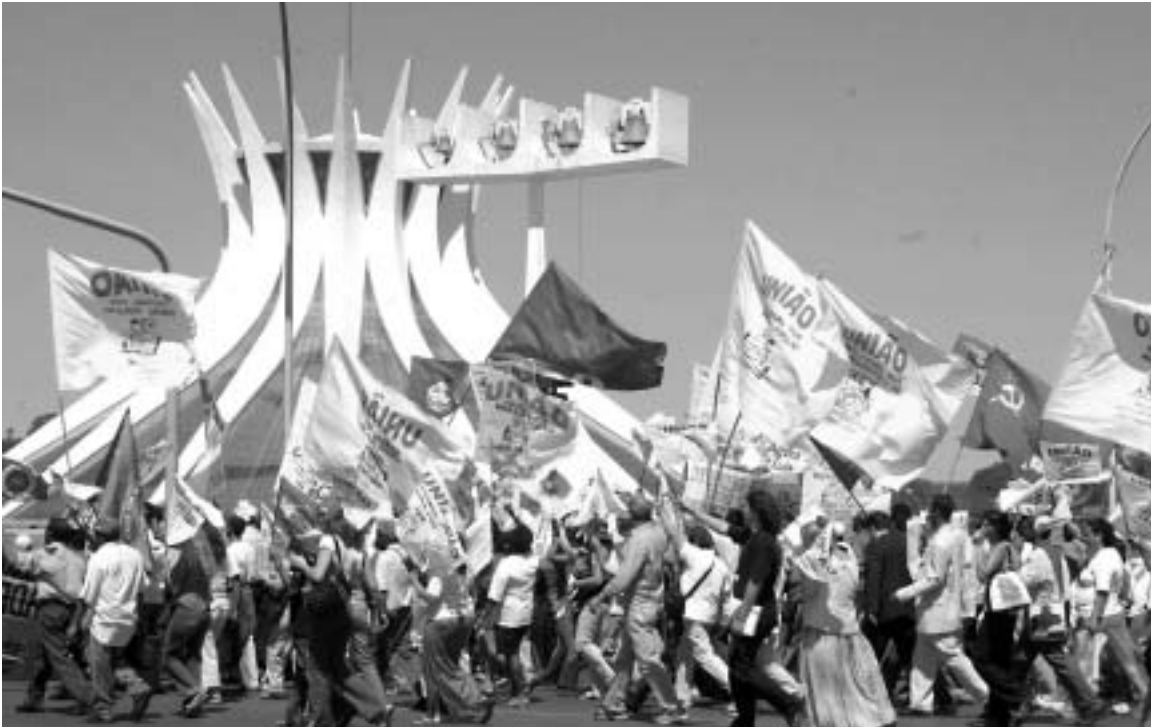
首都ブラジリアでの全国大衆住宅連盟によるデモ行進。

CMPの正式な発足は1993年であるが、80年に設立された前身団体である「全国民衆・労働組合運動連合」(Articulação Nacional dos Movimentos Populares e Sindical: ANAMPOS)の活動を引き継いでおり、まさにブラジルの民衆運動の草分け的存在といえる。当初、ANAMPOSは労働組合運動も含んだ社会運動団体であったが、83年に全国レベルの労働組合団体として「労働者統一本部」(Central Única dos Trabalhadores: CUT)が結成されたことから、労働組合運動を除いた民衆運動に活動を特化していった。CUTに比べCMPの発足が遅れた要因は、労働条件の改善という明確かつ統一的目的、および活動の母体となるすでに組織立った団体のある労働組合運動とは異なり、さまざまな社会問題を包含する全国レベルの団体を組織化するまでに多くの時間と労力を要したためとされる。