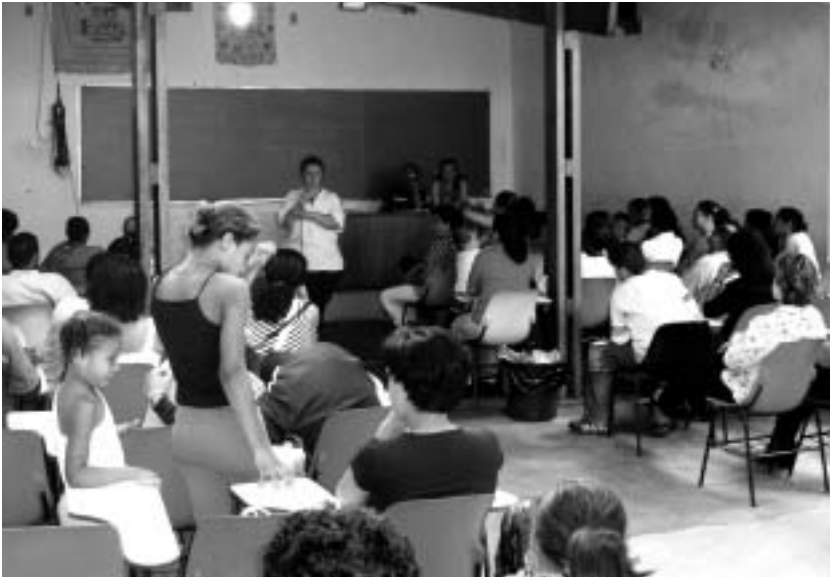
サンパウロ住宅運動連盟の集会場での地区別集会。

報やノウハウが経験者から未経験者にフィードバックされ、住民同士の組織的な関係の強化と維持が可能となっている。