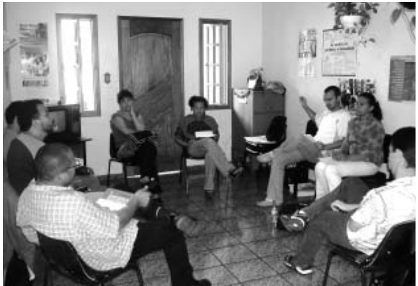
民衆運動本部での地区別代表者による会議。

de Moradia da Grande São Paulo e Interior：UMMSP)は、UNMP傘下のサンパウロ州内を統括する住宅運動団体で、1987年に発足した。現在、UMMSPには州内30の地域を代表する住宅運動団体、およびこれら地域の団体に所属する下部団体を加え、約350もの団体が加盟している。主に劣悪な居住環境にあり所得が最低賃金 (4) の0～3倍の住民を対象としており、約50万人が活動に参加している。