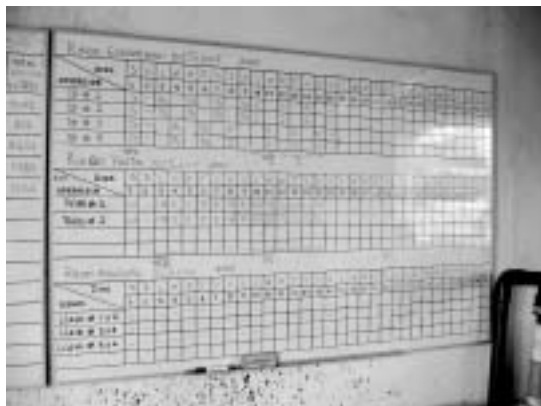
写真2：生産計画に従って点滴灌漑システムを調整する(アグロカサ社サンタ・リタ農場)

もう一つのメリットは人件費の節約である。水に液肥を混ぜることで、施肥に必要な労働力を減