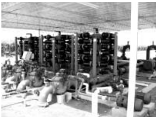
写真3：無線による遠隔操作で点滴灌漑のポンプやバルブを調整する（アグロカサ社ラ・カタリナ農場）

ポカドの栽培も開始した。2006年、同社は1万1973トンの生鮮アスパラガスを生産したが、これは同年のペルーの輸出総量の13%にあたる。