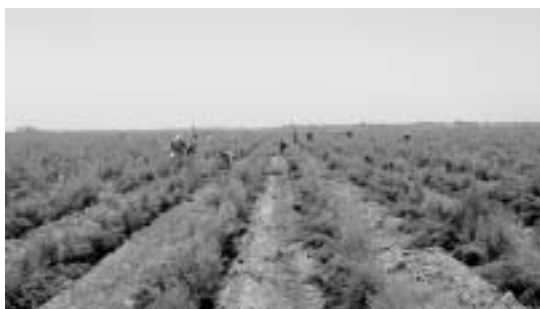
写真1：南部海岸地域イカ市近郊のグリーン・アスパラガス畑 (アグロコラ・チャビ社，写真はすべて筆者撮影)