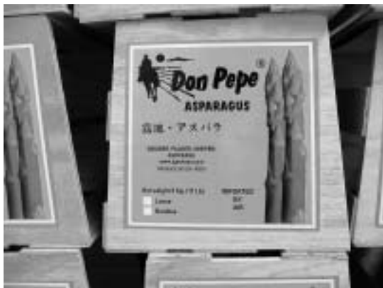
写真5：日本市場向けの木箱（アグロカサ社ラ・カタリナ農場）

長期間安定した供給を約束することで、直接販売の顧客を確保することが狙いである（写真5）。