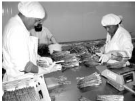
写真4：アスパラガスの加工ライン（アグロカサ社ラ・カタリナ農場）

農場で収穫されたアスパラガスは一時的に農場内の集荷場所に集められるが、劣化を防ぐために1時間以内に加工工場まで運ばれる。工場の水槽で洗浄、冷却され、ここからベルトコンベヤーに乗って処理される。長さ、太さ、色、先端の縮まり具合、傷の有無などによって分類された後、長さが揃うようにカットされる。そして150～450グラムに束ねられてから5キログラムごとに箱詰めされる。市場によって1束の重さや箱の材質が異なる（写真4）。日本向けに輸出する場合は1束100