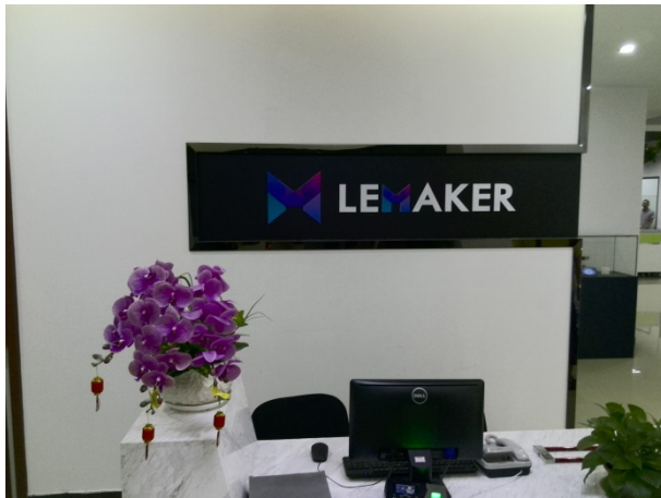
写真 6 LeMaker

きた。SeedやMaker Works、LeMakerは、ものづくりのためのプラットフォームとなる製品を提供しており、ハードウェア系スタートアップ／メイカー市場やSTEM教育市場の拡大とともに、その事業も拡大しそうだ。