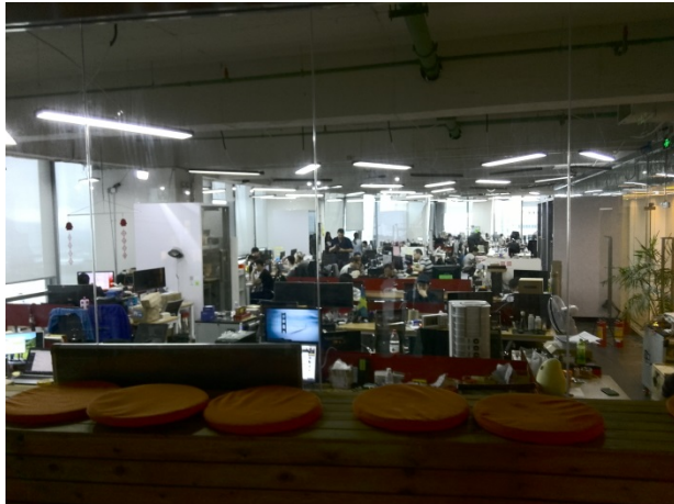
写真 2 HAX