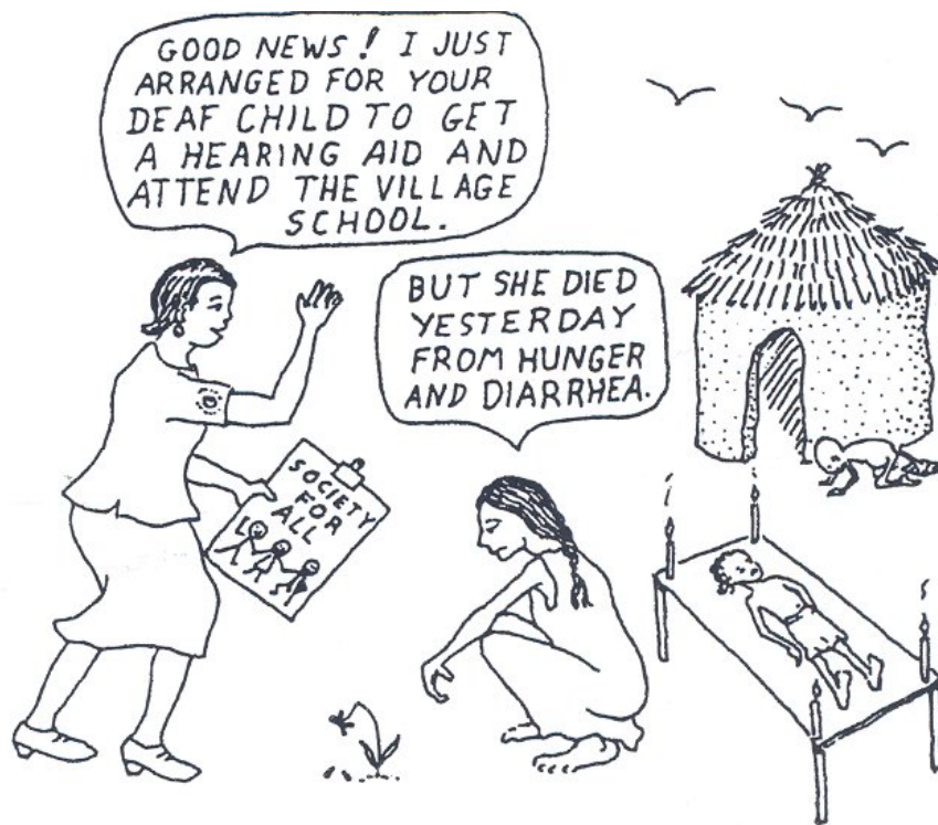
図1：開発と障害：乖離する取り組み